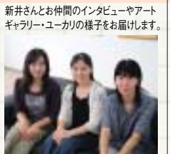
撮影協力:アートギャラリー・ユーカリ(ピオピア・プラザ2F)