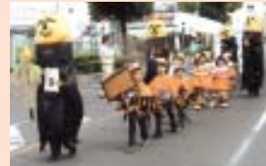
2007年「エコ・カボチャ」