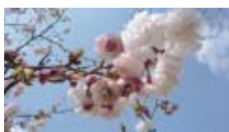
ヒナギクザクラ(雛菊桜)100枚以上の花弁数。小木で自由広場に1本だけあります。見頃は4月上旬頃。

協会との協力で、本丸跡の桜を紹介したガイドマップを発行。更に調査を園内全体に拡大し現行のマップに進化します。以後も調査を続け毎年改訂版を発行。結果約50品種約1100本の桜を確認。早咲きから遅咲きまで長く開花を楽しむことができる城址公園の桜の魅力を確認しました。一方で、枯れてしまった品種や病気の桜もあり、専門家による保護の重要性を唱えます。最近では、城址公園を案内する市民公益活動団体「佐倉城址公園ボランティアの会」と連携し、来園者への桜案内も担当。また、樹名板も相互協力で設置。良き道標となっています。桜調査のみならず、秋から冬は剪定作業に取り組みます。花見の季節を迎え、来園者が「さくらまふ」を手に桜を愛で魅力を実感、城址公園に惹きつけられて頂くことが会の願いです。