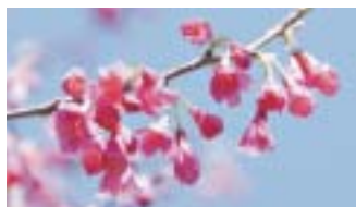
カンヒザクラ(寒緋桜)沖縄での「サクラ前線」基準花。下向きに咲き、散る時は花ごと落ちます。見頃は3月下旬頃。