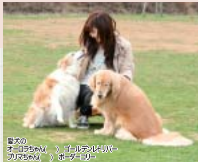
愛犬のオーロラちゃん( )、ゴールデンレトリバー、ブリマちゃん( )、ボーダーコリー