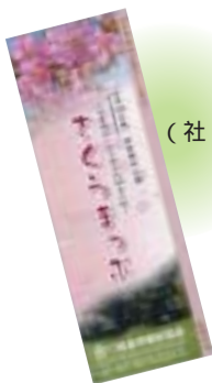
(社)佐倉市観光協会にて配布中!