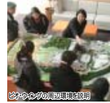
ピオウイングの周辺環境を説明