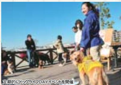
定期的にドッグライフDAYイベントを開催