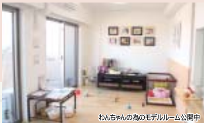
わんちゃんのためのモテリールーム公開中

問 犬のしつけサポート 『スノア』 佐倉市西志津5-6-10 ☎043-497-6078 E-mail info@dogtraining.jp ホームページ http://dogtraining.jp/