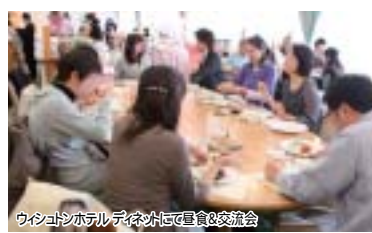
ウイニングホテルでランチを囲む様子