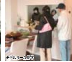
モテリールーム見学