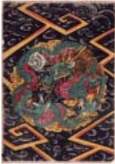
風絵 龍と達磨(部分)

平成23年12月20日(火)～平成24年1月29日(日) 9:30～16:30 (入館は16:00まで) ※月曜日(月曜日が祝日の場合は翌日休館) および年末27日～年始4日まで休館